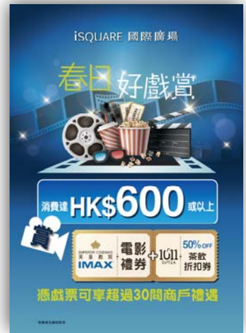
與購物商場進行聯合推廣