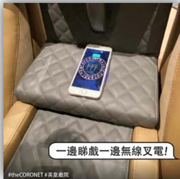
配備無線充電設備之座椅