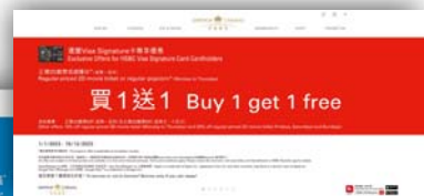
與信用咭發行商進行聯合推廣