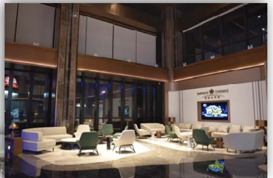
成都 – 等候廳