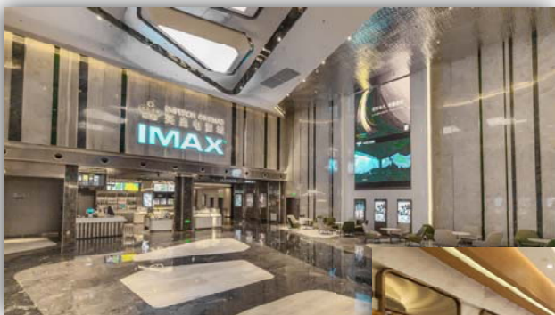
贛州 - 戲院大堂