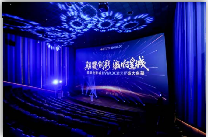
IMAX Laser 放映院