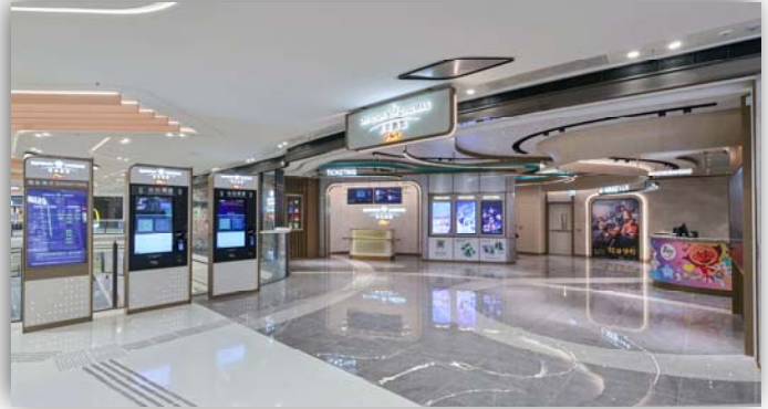
香港大圍圍方 – 大堂