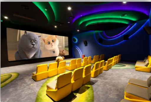
重慶 – Dreamland 放映院