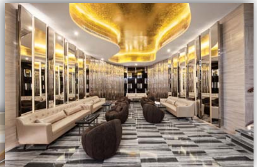
合肥 - 貴賓廳