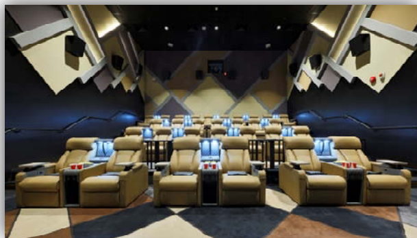
澳門葡京人 – the CORONET 貴賓放映院