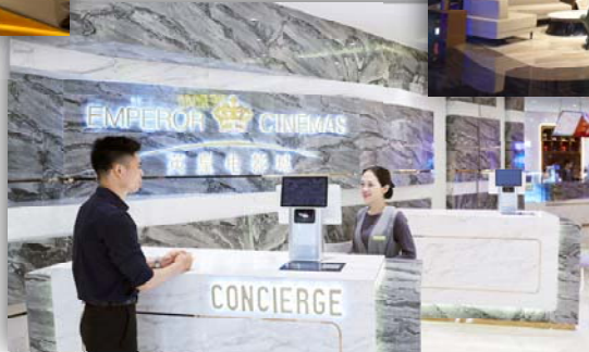
深圳 – 禮賓部