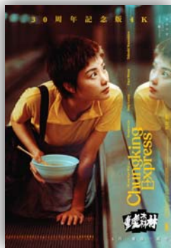
《重慶森林》30周年 4K 版本