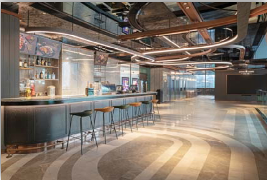
香港 iSQUARE 國際廣場 – 餐飲部