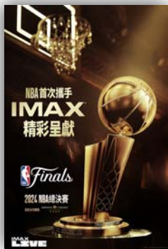
2024 NBA 總決賽