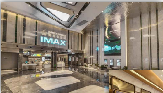
贛州 - 戲院大堂